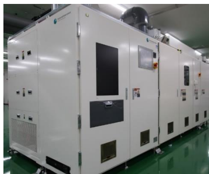
図2 開発した \beta -Ga 2 O 3 成膜向け6インチ枚葉式HVPE装置の外観写真

また、成膜条件の最適化や独自の原料ノズル構造の採用により、6インチテストウエハ上における \beta -Ga 2 O 3 成膜の実証、および \beta -Ga 2 O 3 膜厚分布 \pm 10\% 以下を達成するなど面内で均一な成膜が可能であることも確認しました(図3)。本成果で確立した大口径基板への成膜技術やハードウェアの設計技術により \beta -Ga 2 O 3 成膜装置のプラットフォームを構築できるため、大口径バッチ式量産装置の開発を大きく進展させることが可能となりました。これにより、 \beta -Ga 2 O 3 成膜プロセスおよびデバイスの適用による消費電力削減によって、2030年時点で21万kL/年程度の省エネルギー効果が見込まれています。